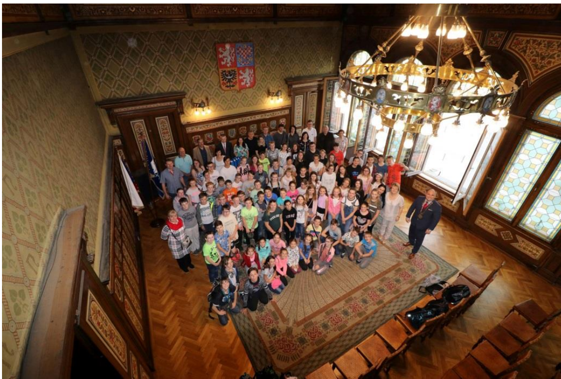
Na náhodské radnici s představiteli města...

připraven program ve třech tematických skupinách. Tématem česko-slovenské výuky byly společné znaky, odlišnosti a tradice. Během výměnných pobytů se naši žáci přesvědčili o tom, že i když žijí ve dvou odlišných státech, mají Češi i Slováci mnoho společného a i když se se slovenštinou běžně nesetkávají, dokáží jí porozumět. I tak krátké pobyty byly velkou inspirací pro učitele naší školy. Ze Slovenska si odvezli spoustu inspirace a zkušeností.