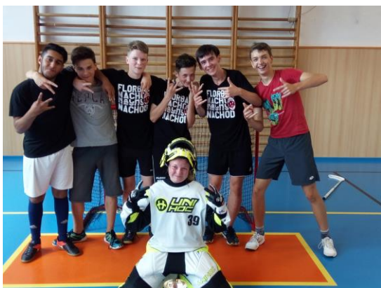
Vítězná 8. C.....