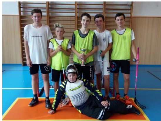
....druhá byla 8. D