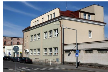
Českých bratří – II. třídy